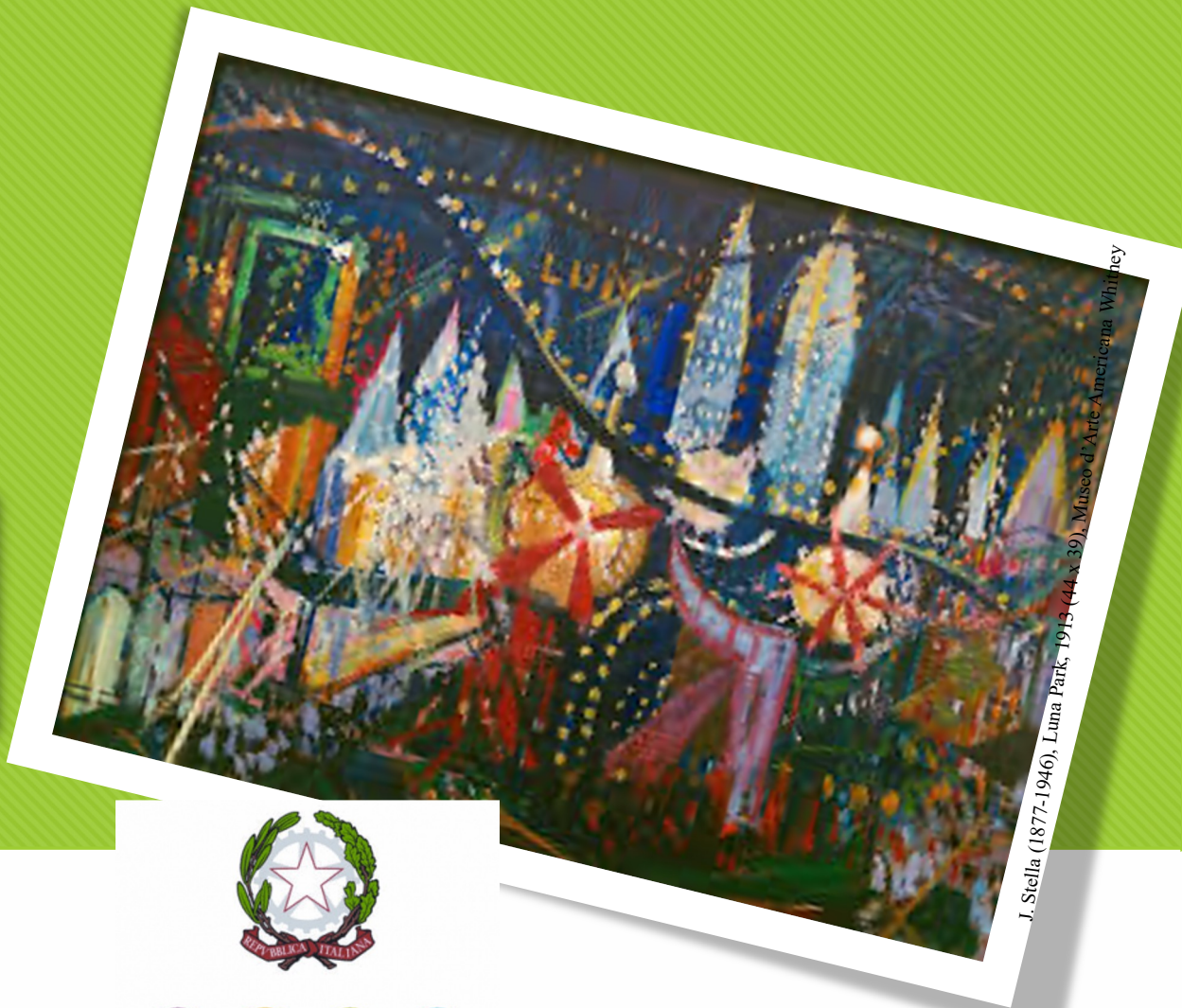
J. Stella (1877-1946), Luna Park, 1915 (44 x 39), Museo d'Arte Americana Whitney